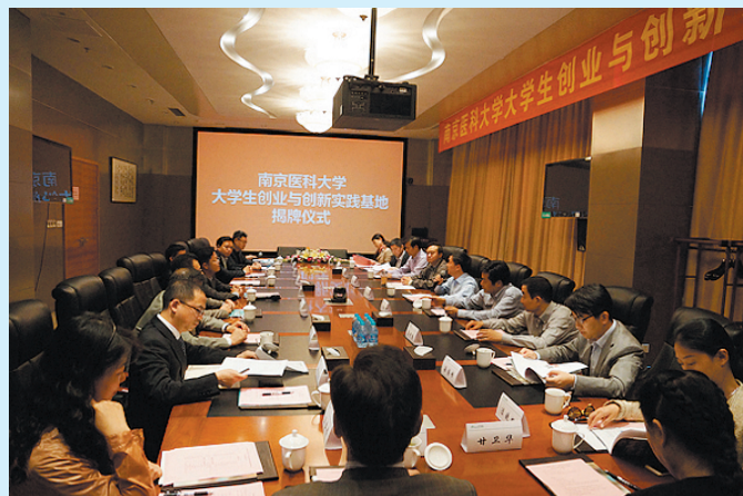
我校举行首个“大学生创新创业实践基地”揭牌仪式