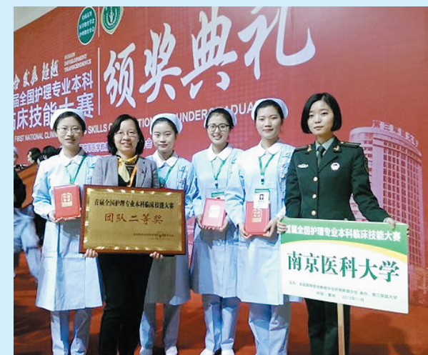
我校获全国首届护理专业本科临床技能大赛二等奖