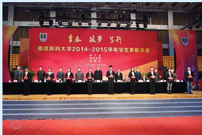
我校举行2014—2015学年学生表彰大会