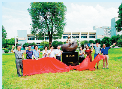
医疗系85届校友毕业三十周年捐赠“爱之源”雕塑