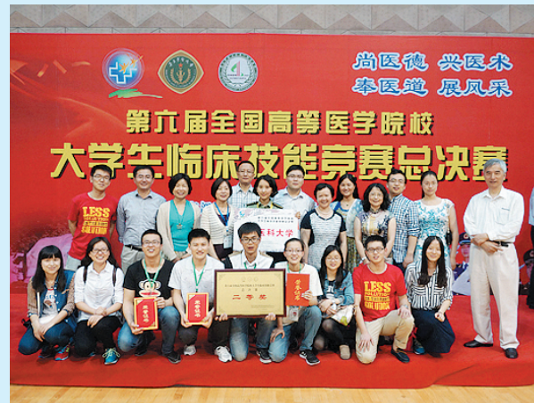
我校获得第六届全国高等医学院校大学生临床技能竞赛二等奖