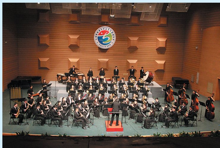
我校管乐团荣获全国大学生艺术展演活动一等奖