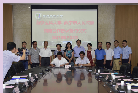
与西宁市签署战略合作协议签约仪式