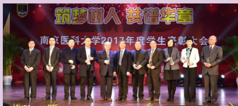
2017年度学生表彰大会隆重举行