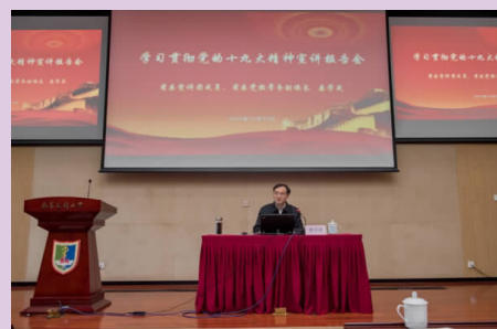
学习贯彻党的十九大精神宣讲报告会