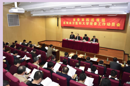
省委第四巡视组巡视我校党委工作动员会