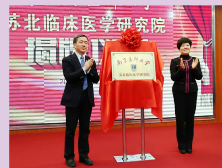
我校苏北临床医学研究院正式揭牌