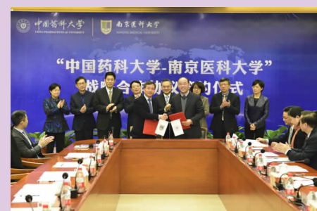
我校与中国药科大学签署战略合作协议