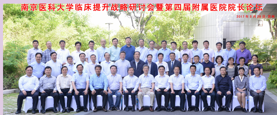
第四届附属医院院长论坛