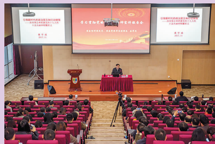
中国共产党南京医科大学第十六次代表大会