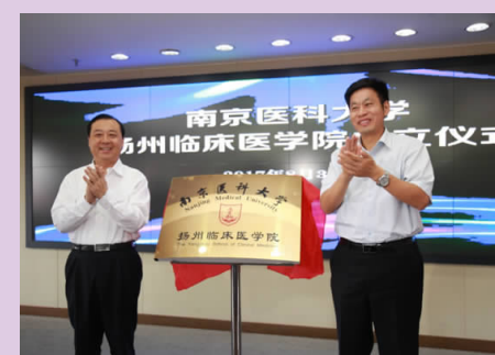
我校与扬州市合作共建成立扬州临床医学院