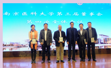
董事会三届四次会