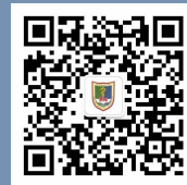
南医校友会公众号