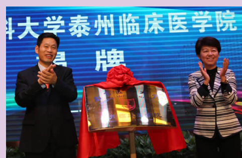
我校与泰州市合作成立泰州临床医学院