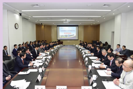
省教育厅对我校本科教学工作审核评估顺利完成