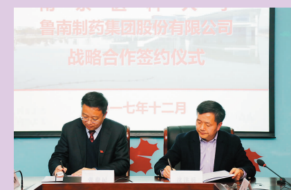
我校与鲁南制药集团签署战略合作协议